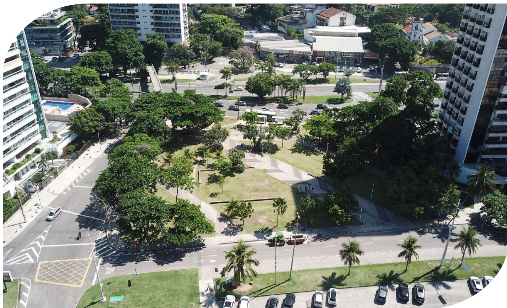
Praça Mariangeles Maia em São Conrado