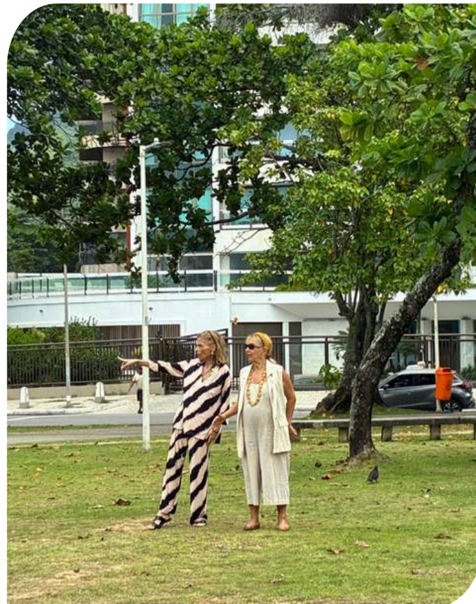
Visita técnica de nossas apoiadoras à Praça Mariangeles Maia

Entre os projetos já protocolados, destacam-se as soluções para coibir o tráfego irregular de motos na contramão sob o Viaduto Mestre Manoel, a criação de acesso direto à orla pela Avenida Aquarela do Brasil e a retomada da revitalização da Avenida Almirante Álvaro Alberto — iniciativas que buscam melhorar o fluxo, reduzir riscos e integrar melhor o bairro.