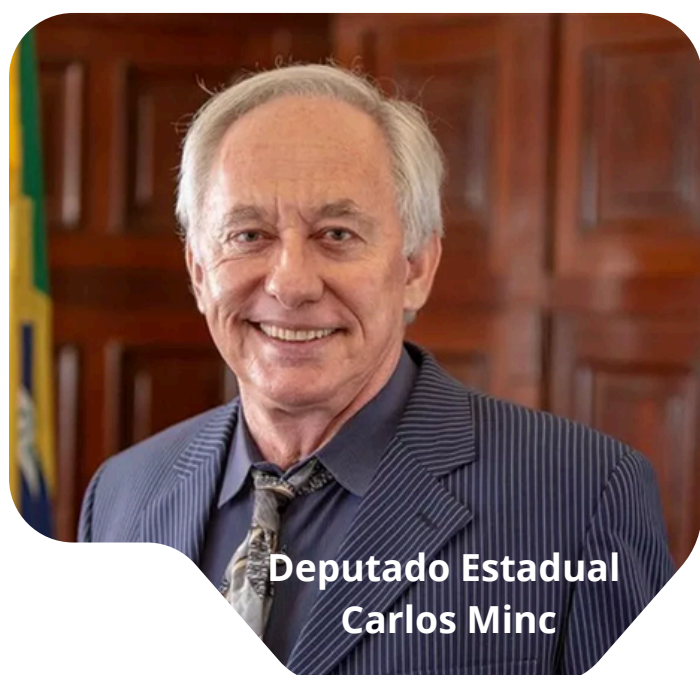
Deputado Estadual Carlos Minc

Minc enfatiza parcerias para inclusão. Nas Fábricas Verdes, com poder público, PUC-Rio e Rocinha, jovens recuperaram computadores descartados: de três inservíveis, dois viravam inclusão digital em telecentros. “Qualidade de vida exige diálogo entre associações, moradores e comunidade”.