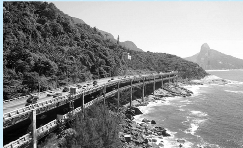
O Elevado nos dias hoje.

P ara relembrar um pouco os marcos de São Conrado, a Amasco publica nesta edição, três fotografias do Elevado das Bandeiras, mais conhecido como Elevado do Joá. Uma fotografia que já é histórica e outras que vão se tornar.