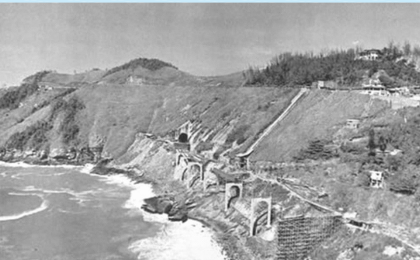
O Elevado do Joá, em construção no início dos anos 70.