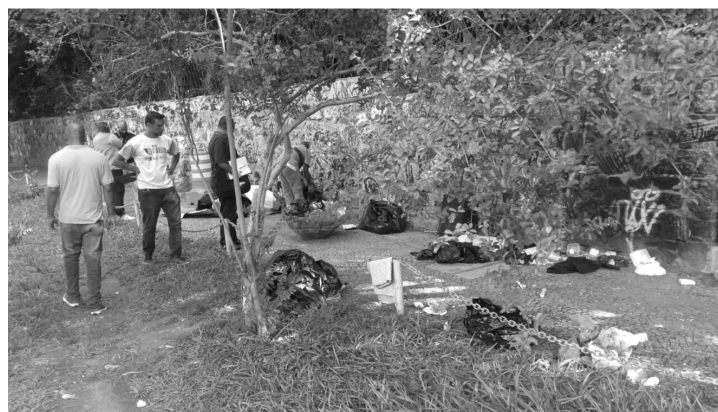
Muro do Gávea Golfe em frente ao Fashion Mall

Realmente, tem sido uma enorme batalha o acolhimento de moradores de rua feito pela Prefeitura, através da Secretária Municipal de Assistência Social e de Direitos Humanos. Decreto sancionado pela própria Prefeitura determina que moradores de rua não podem ser acolhidos contra sua vontade. Com isso, a Secretária tem que fazer um trabalho de convencimento para que o morador de rua aceite seu acolhimento e seja levado para abrigos da Prefeitura. Isso foi feito com vários moradores de rua que se encontravam acampados no muro do Gávea Golfe, em frente ao Shopping Fashion Mall. Todo o lixo deixado por eles foi recolhido pela COMLURB, como mostra a foto da matéria.