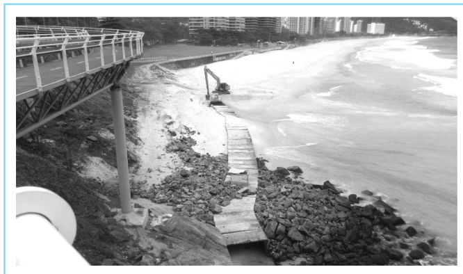
Galeria de Cintura como era antes da destruição e obstrução.

costão do Pepino, a fim de evitar assoreamentos. Na primeira grande ressaca, em abril de 2016, o conjunto sofreu deslocamentos e assoreamento. Com o passar do tempo estas deformações foram se acentuando e culminou com o tamponamento completo do trecho final da galeria impedindo os lançamentos das águas no mar. Mesmo com