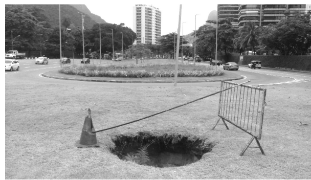
Cratera no retorno da autoestrada no Pepino.