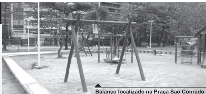
Balanço localizado na Praça São Conrado

Vamos continuar cobrando a solução do problema!