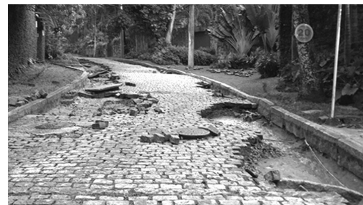
Chuvas detonam a Rua Iposeira.

As últimas e torrenciais chuvas que caíram no Rio de Janeiro causaram vários estragos em São Conrado. Foi o afundamento da pista da ciclovia Tim Maia no Pepino, destruição final e assoreamento da galeria de cintura, queda de parte do calçadão da orla, várias crateras apareceram em canteiros do bairro e diversas ruas destruídas pelas correntezas das águas. O lado bom é que não houve perda de vidas!