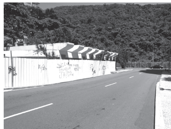
Tapume colocado na Elevatória da CEDAE na Niemeyer

Após várias solicitações da Amasco, que ficaram sem resposta da CEDAE, encaminhamos a reclamação para a Prefeitura, que comunicou estar multando a CEDAE devido a essa irregularidade. E aí CEDAE, quando é que vocês vão recuar esse tapume?