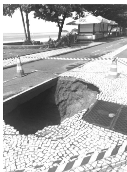
Cratera no calçadão da Praia.