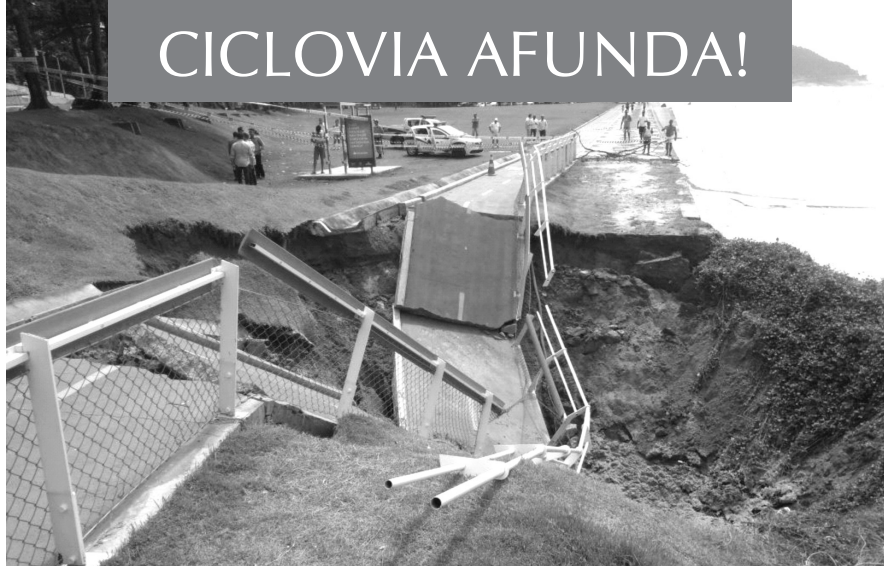
Trecho da ciclovia Tim Maia no Pepino

Com as constantes e fortes chuvas do mês de fevereiro, um trecho da ciclovia Tim Maia - que fica no Pepino -, afundou em razão da erosão do aterramento local e aparentemente cooptado pelo assoreamento da saída de águas pluviais da Galeria de Cintura, já destruída a algum tempo, o que causou a retenção de águas das chuvas que retornaram e foram criando uma erosão no local.