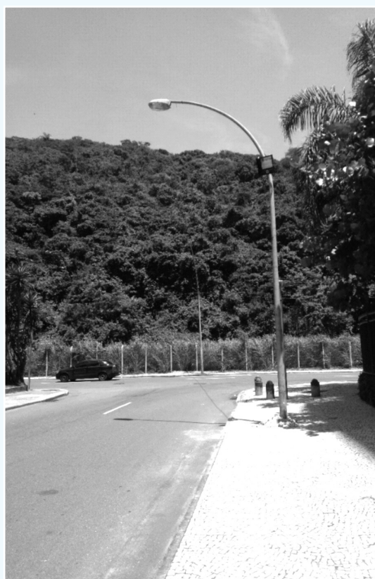
Poste colocado em frente a Elevatória da CEDAE

Com a construção da ponte que liga a Avenida Niemeyer a Av. Aquarela do Brasil, a área em questão foi urbanizada e foram colocados três postes baixos com pequenas luminárias para iluminação do local. Passados alguns meses, as luminárias se apagaram. Várias solicitações foram feitas para a Rio Luz, que após algum tempo nos informou que os postes e luminárias não eram padrões, por isso não eram reconhecidos pela Rio Luz. A Amasco então, após uma típica novela, conseguiu que a Rio Luz colocasse poste adequado para manutenção, com luminária superior e refletor mais abaixo no poste. Ufa! Problema resolvido!