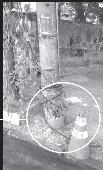
Poste batido por veículo na Niemeyer

Na mesma curva onde a mureta foi quebrada, outro veículo desgovernado colidiu e danificou totalmente um poste de iluminação pública da Light. O poste está na calçada do número 750, antes da curva perigosa da Avenida Niemeyer.