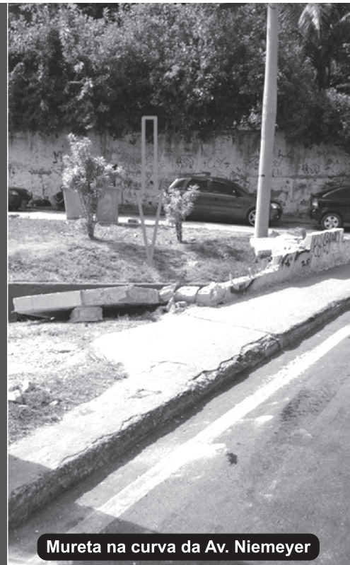
Mureta na curva da Av. Niemeyer

Alô, Prefeitura, vamos resolver a questão?