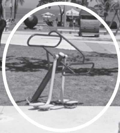
Equipamento solto na Praça São Conrado

Um dos aparelhos de ginástica da terceira idade se soltou por completo, como mostra a fotografia da matéria. A Amasco encaminhou solicitação à Secretaria Municipal de Conservação para recolocação do aparelho.