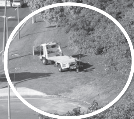
Caminhão estacionado irregularmente sobre gramado.

Como mostra a fotografia da matéria, caminhões estão acessando o canteiro que fica na pista central da autoestrada Lagoa Barra, no retorno para Estrada do Joá localizado antes da subida para o Túnel São Conrado, e estacionam irregularmente no local. Há dias em que até três caminhões estão sobre o gramado recém-plantado e passam por cima do meio-fio onde não existe acesso. O fato já foi comunicado à Prefeitura.