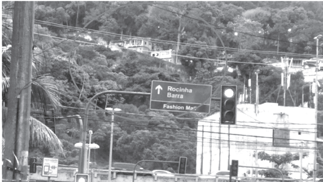
Construções irregulares avançam na Vila Verde