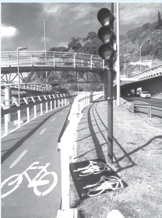
Placa na ciclovia foi arrancada.

Até quando a Prefeitura vai ignorar este problema?