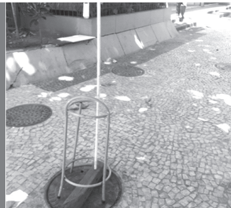
Bueiro na altura do número 847 da Estrada da Gávea

A tampa era menor que o aro do bueiro e trazia risco de queda aos pedestres que passavam pelo local. A Amasco acionou a Superintendência da Zona Sul, que encaminhou o problema ao órgão competente e o mesmo foi solucionado.