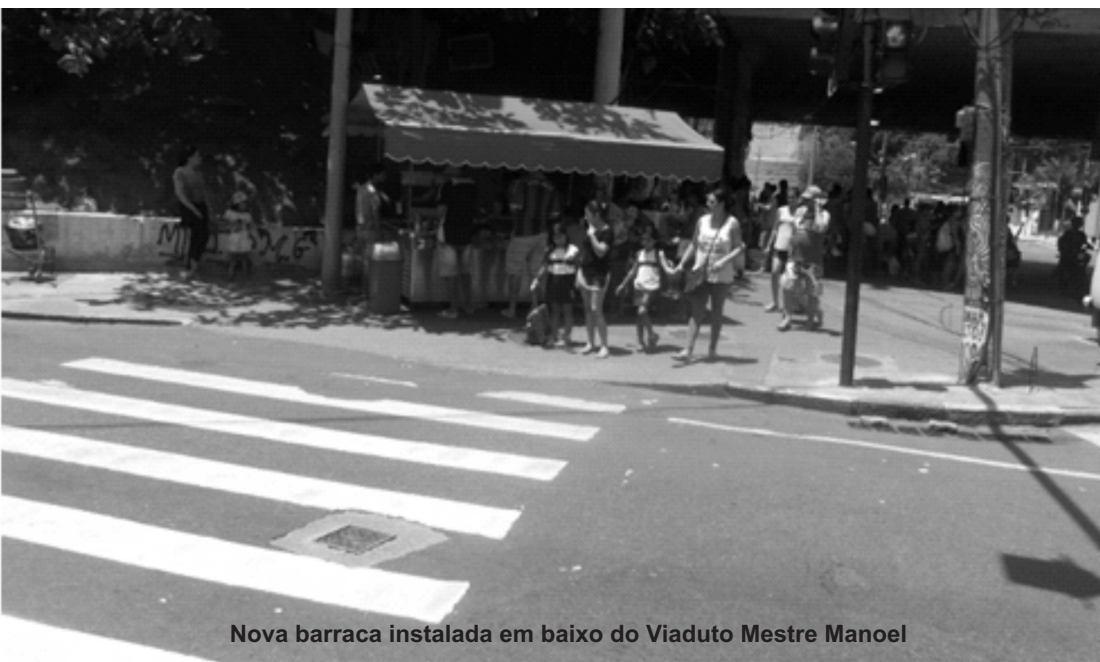
Nova barraca instalada em baixo do Viaduto Mestre Manoel