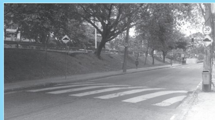
Lombada reimplantada na Estrada da Gávea

Em meados do ano, a Prefeitura retirou todas as lombadas da Estrada da Gávea e Estrada do Joá para que fossem realizadas as provas de ciclismo das Olimpíadas.