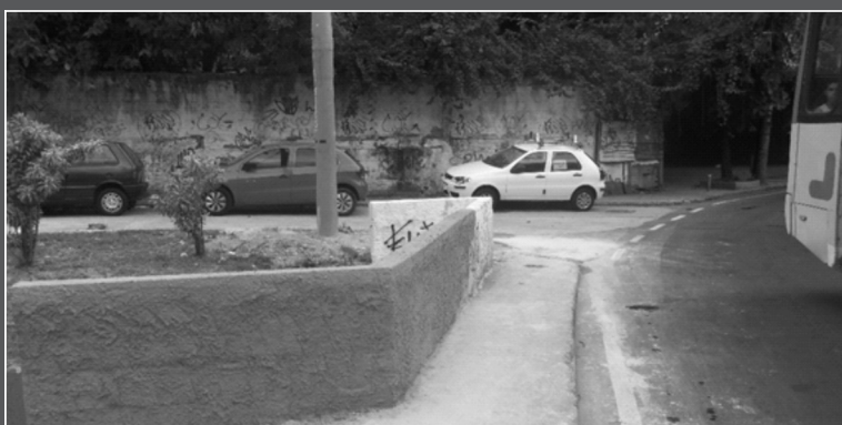
Mureta consertada na Niemeyer

A Amasco encaminhou solicitação a divisão e conservação do Alto da Boa Vista para reerguer a mureta e no final desta edição recebemos e-mail da Divisão de Conservação comunicando que a mureta foi consertada.