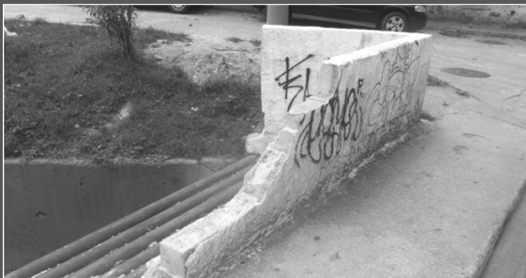
Mureta danificada na Niemeyer

P ela milésima vez, a mureta de proteção que fica sobre a canal que passa pela Avenida Niemeyer, na curva fechada ao lado do Mercado Supermarket, foi atingida por veículo desgovernado.