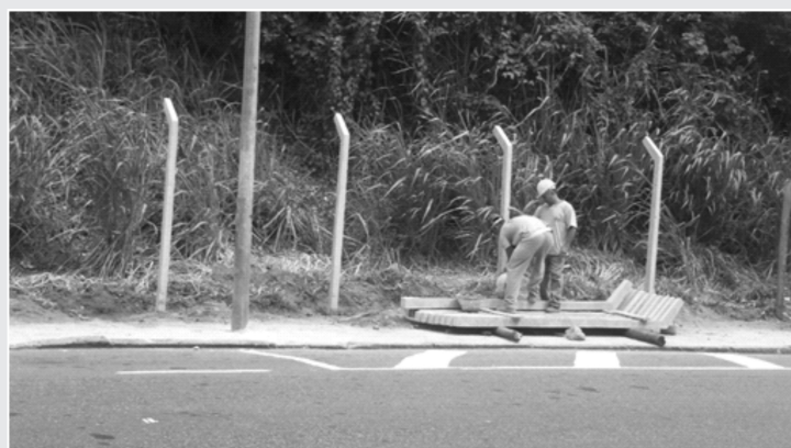
Pilares de concreto são utilizados

C erca colocada há anos por moradores, nos terrenos da encosta da Avenida Niemeyer, que sofreu com vandalismo e ultimamente com a colocação do terminal de ônibus na Niemeyer, está sendo recolocada, a pedido da Amasco, pelos empreendedores do Hotel Nacional que têm colaborado de forma positiva por melhorias no bairro.