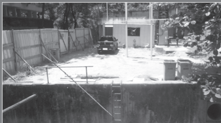
Estação Elevatória na Av. Niemeyer

C onforme publicado em nosso número anterior, as obras da Estação Elevatória da CEDAE, que teve um início insatisfatório e foi paralisada pela CEDAE até os dias de hoje, continuam paradas após quatro anos de seu início.