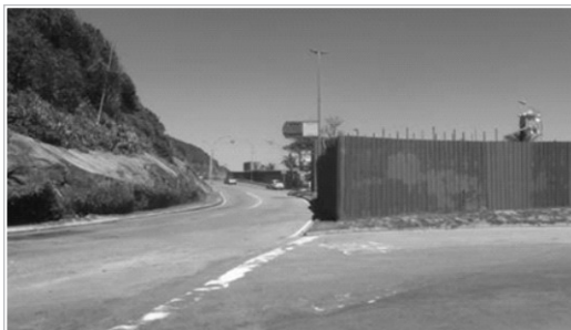
Curva perigosa na descida da Niemeyer

A Amasco propõe a mudança do limite de velocidade dessa Lombada Eletrônica para 50km/h. (foto abaixo).