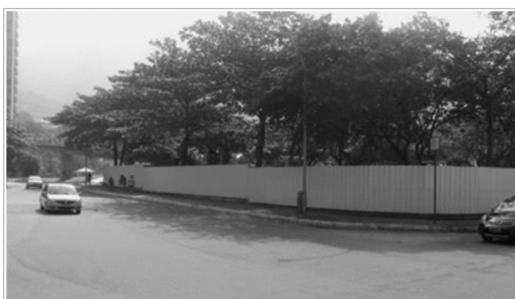
Tapumes tapam a visão no cruzamento

A Amasco solicita a colocação de sinalizações adequadas e propõe que dentro dessas sinalizações seja colocado um sinal em "flash" na esquina dessas duas vias, em ambos os lados do cruzamento. (foto abaixo).