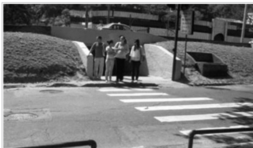
Travessia perigosa com carros em alta velocidade

A Estrada da Gávea fica em ambos os lados da Autoestrada Lagoa Barra. No sentido Barra já existe sinalização adequada com lombada e semáforo. No sentido Gávea é extremamente necessária essa lombada, pois os veículos circulam em alta velocidade. A passagem subterrânea é utilizada por grande parte da população do bairro, funcionários do Fashion Mall, dos condomínios e por centenas de estudantes das escolas que ficam no sentido Barra e moram do outro lado da Estrada. Os ônibus e veículos fazem dessa via uma verdadeira pista de corrida. Além da lombada, solicitamos também que sejam colocadas placas dentro da passagem subterrânea, próximas das duas saídas, alertando para a travessia, pois a calçada de espera é muito estreita e quando os transeuntes saem da passagem, ficam muito próximos da pista junto ao meio fio que é baixo. É também necessário afastar um pouco o atual ponto de ônibus ali existente, pois o mesmo fica quase em cima da faixa de travessia dos pedestres e os ônibus param em cima da faixa e embaixo do sinal, não permitindo a travessia. (Fotos abaixo).