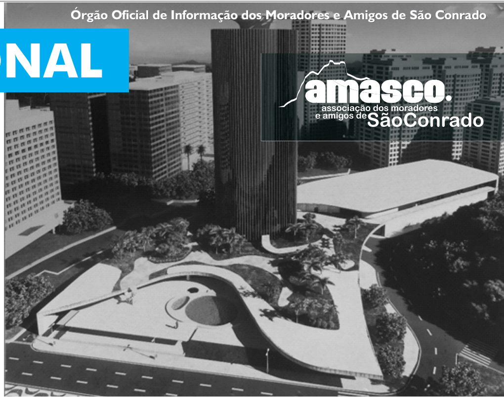
Maquete da reforma do Hotel

Projetado pelo arquiteto Oscar Niemeyer, inaugurado em 1972, fechado desde 1995, leilado em 2009 e adquirido por um grupo de empresários goianos, o prédio do hotel Nacional dá início às obras de recuperação estrutural, com promessa de reabertura antes da Olimpíadas de 2016.