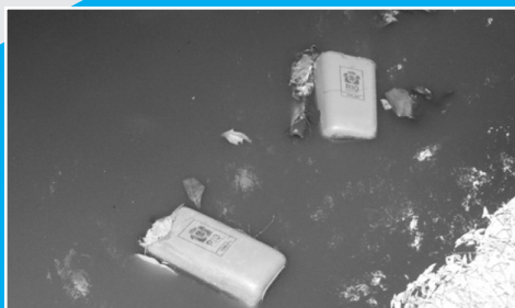
Papeleiras dentro do Canal da Avenida Aquarela do Brasil

Vejam onde foram parar as papeleiras compradas com o dinheiro do povo e destruídas pelo próprio povo. Podem ter certeza de que isso é obra de desocupados e descomprometidos com ordem, educação e responsabilidade de cidadão de proteger sua cidade. No entorno do Fashion Mall, já sumiram duas papeleiras novinhas e recém-colocadas pela Comlurb.