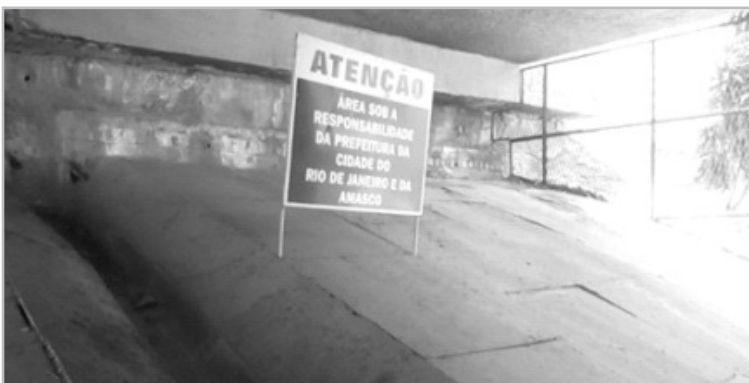
Área protegida e limpinha!

Por solicitação da Amasco, a COMLURB deu uma geral nas áreas protegidas por grades em baixo do Viaduto Mestre Manoel. Foram limpas as canaletas de água existentes no local, bem como realizada a retirada de uma grande quantidade de lixo e apetrechos de moradores de rua que estavam começando a ocupar o local.