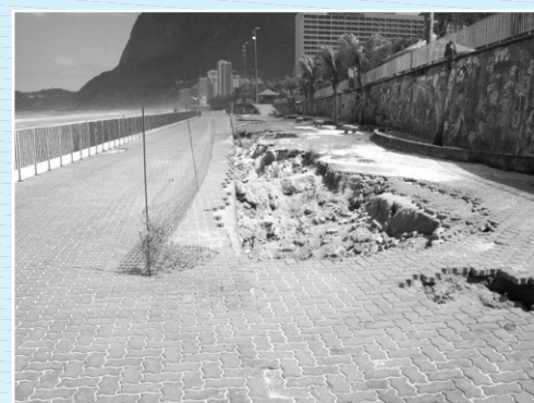
Crateras no calçadão em 2012

As fotografias, abaixo, mostram o calçadão, primeiro, destruído e como ficou depois das obras. Parabéns para todos nós! E fica registrado, aqui, um agradecimento especial ao RJTV que esteve o tempo todo nesta luta ao lado os moradores, ao empenho da Rio Águas na solução do problema, ao grupo "Salvemos São Conrado" e aos nossos moradores que participaram ativamente desta luta.