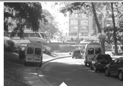
Avenida Aquarela do Brasil, paraíso de vans, caminhões e ônibus.

Seja na Av. Aquarela do Brasil, na Av. Almirante Álvaro Alberto, na Rua General Olímpio Mourão Filho, na Estrada da Gávea ou em outro logradouro do bairro, as vans não têm o menor pudor ao estacionarem onde lhes convier. Como mostram as fotografias, na Aquarela estacionam até nos espaços em que existem placas de proibido parar e estacionar. Já na Álvaro Alberto, todos os dias os veículos estão em cima da calçada, com as portas abertas e seus motoristas almoçando ou tirando uma soneca. O pedestre que se dane. E, cadê a fiscalização?