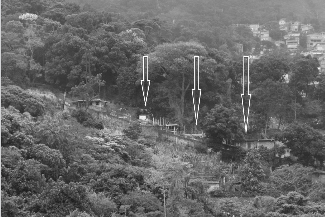
A Rocinha ao fundo com crescimento da Vila Verde demarcado com setas.

Disque Denúncia - Programa de Linha Verde - 0300.253.1177