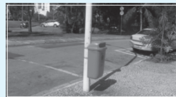
Uma das novas Papeleiras colocadas ao lado do Shopping Fashion Mall

O trabalho foi executado no mês de outubro e foram colocadas novas papeleiras na Estrada da Gávea, em ambos os lados da Autoestrada Lagoa Barra, no entorno do Fashion Mall (foto da matéria), e em toda a área nas imediações do Hotel Royal Tulip.