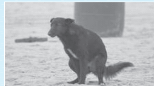
... CENAS PROIBIDAS