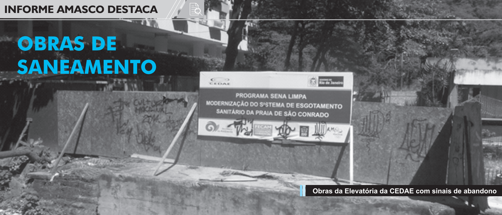
Obras da Elevatória da CEDAE com sinais de abandono