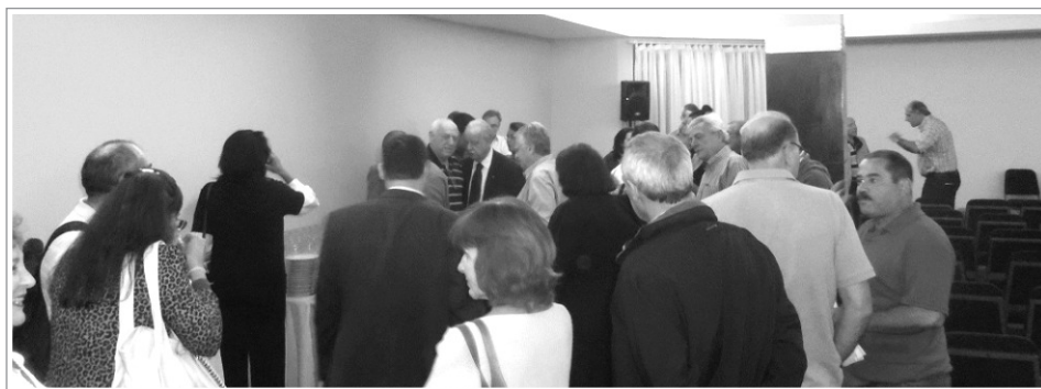
Confraternização pelos 32 anos da Amasco