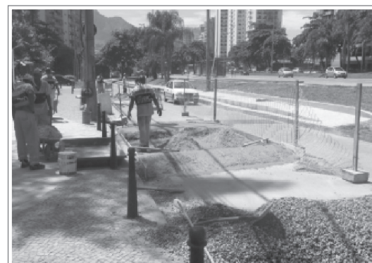
A segunda faixa de pedestre e redutor em construção na Estrada do Joá

Esperamos poder contar com os responsáveis desses alunos, para que orientem seus pequenos a atravessarem na faixa, evitando acidentes desnecessários.