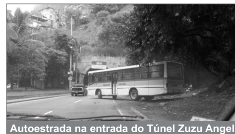
Autoestrada na entrada do Túnel Zuzu Angel

alta velocidade, e segue em direção ao Leblon. Mas, em outras oportunidades, eles atravessam a estrada e usam a área de serviço entre as duas pistas retornando sentido Barra. Neste caso o perigo é ainda maior. Já solicitamos à Cet-Rio o fechamento dessa área de serviço. Até a presente data nada foi feito. Vem Prefeitura, vem Prefeitura!