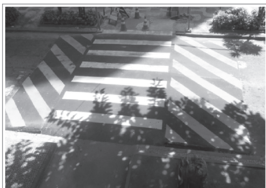
Passagem de pedestre e redutor de velocidade em elevação.

A Prefeitura, através da Cet-Rio, continua dando andamento as solicitações da AMASCO e está implantando em dois pontos da Estrada da Joá, passarelas suspensas (speed table) que visam dar maior segurança aos pedestres com a redução da velocidade dos veículos que descem o Joá e a Estrada da Canoá.