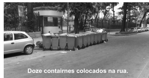
Doze contâineres colocados na rua.

Fazemos um apelo aos síndicos dos condomínios de São Conrado que sigam o exemplo dos Edifícios Port Of Spain e Port Trouville, que por solicitação da Amasco criaram um recuo dentro de suas grades aonde acondicionam o lixo fora do alcance de predadores. O portão fica fechado e quando a COMLURB chega o porteiro o abre para o recolhimento sem problemas, pois o lixo não se espalha.