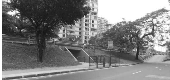
Passagem subterrânea sob a Autoestrada Lagoa Barra

Brasil ao lado do edifício novo, são ambulantes na Estrada da Gávea no entorno do mercado Extra (fechado e abandonado), são moradores de rua na passarela de São Conrado, na Rua Gen. Olímpio Mourão Filho e outros pontos do bairro, é o estacionamento irregular em todos os logradouros do bairro, é o terminal rodoviário de ônibus e vans instalados na Av. Aquarela do Brasil e agora a novidade são motocicletas com escapamento adulterado produzindo grande barulho de dia e de noite perturbando o silêncio alheio. Foram listados alguns problemas, mas existem muitos outros que não são atacados pelo poder público, apesar dos comunicados da Amasco. Alô SEOP cadê as operações que seriam feitas em São Conrado?