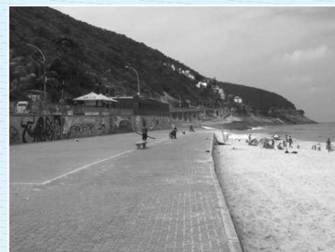
Calçadão recuperado em 2014

Pequenas atitudes podem contribuir para uma melhor qualidade de vida para todos!