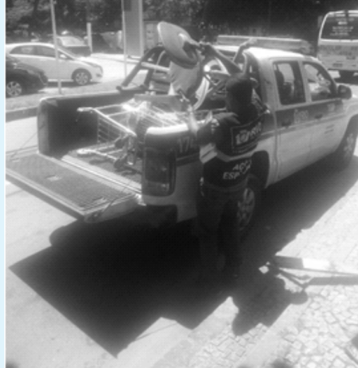
Até cadeiras foram retiradas

Em razão da reclamação de moradores, a VI Região Administrativa e a Secretaria Municipal de Ordem Pública - SEOP, em operação conjunta com a CRS - GM Rio, em 22/03, retiram os ambulantes que montaram diversas barracas no mini terminal de ônibus no início da Estrada do Joá. Segunda a RA a rotina será mantida no local.