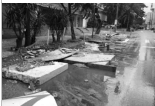
Materiais na pista da Estrada da Gávea

A Amasco recebeu de um morador a reclamação de que as tampas de concretos feitas para obras do Metrô e depósitos de matérias de construção junto ao meio fio retiveram às águas na última chuva forte e ouve inundações na Estrada da Gávea.